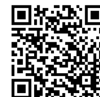
ປຶ້ມຄູ່ມືການ

ດ້ານໃນຂອງແຜ່ນເຮັດຄວາມຮ້ອນແມ່ນເຕັມໄປດ້ວຍຫີນແຮ່ທຳມະຊາດເພື່ອຊ່ວຍຮັກສາຄວາມຮ້ອນ.